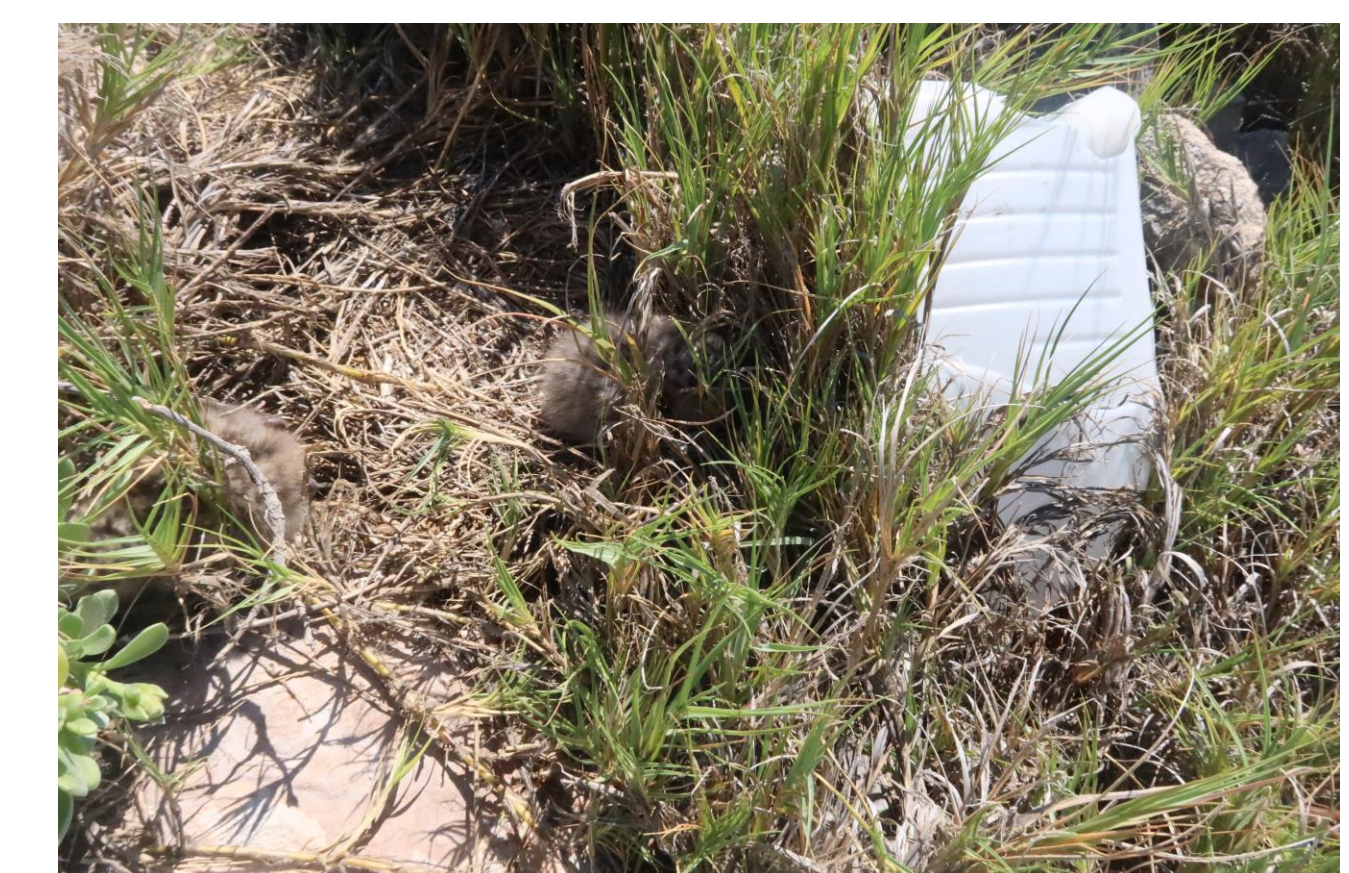
Galón de plástico cerca de un nido de Leucophaeus atricilla

Se identificaron cuatro amenazas para la reproducción de aves acuáticas. Entre estas resalta la presencia de cinco aves depredadoras, entre las que destaca L. atricilla . Las especies con mayor número de amenazas fueron O. anaethetus y T. sandvicensis . Esta última es sensible a perturbaciones del hábitat. La contaminación por plásticos es otro tema importante a resolver como estrategia de manejo.