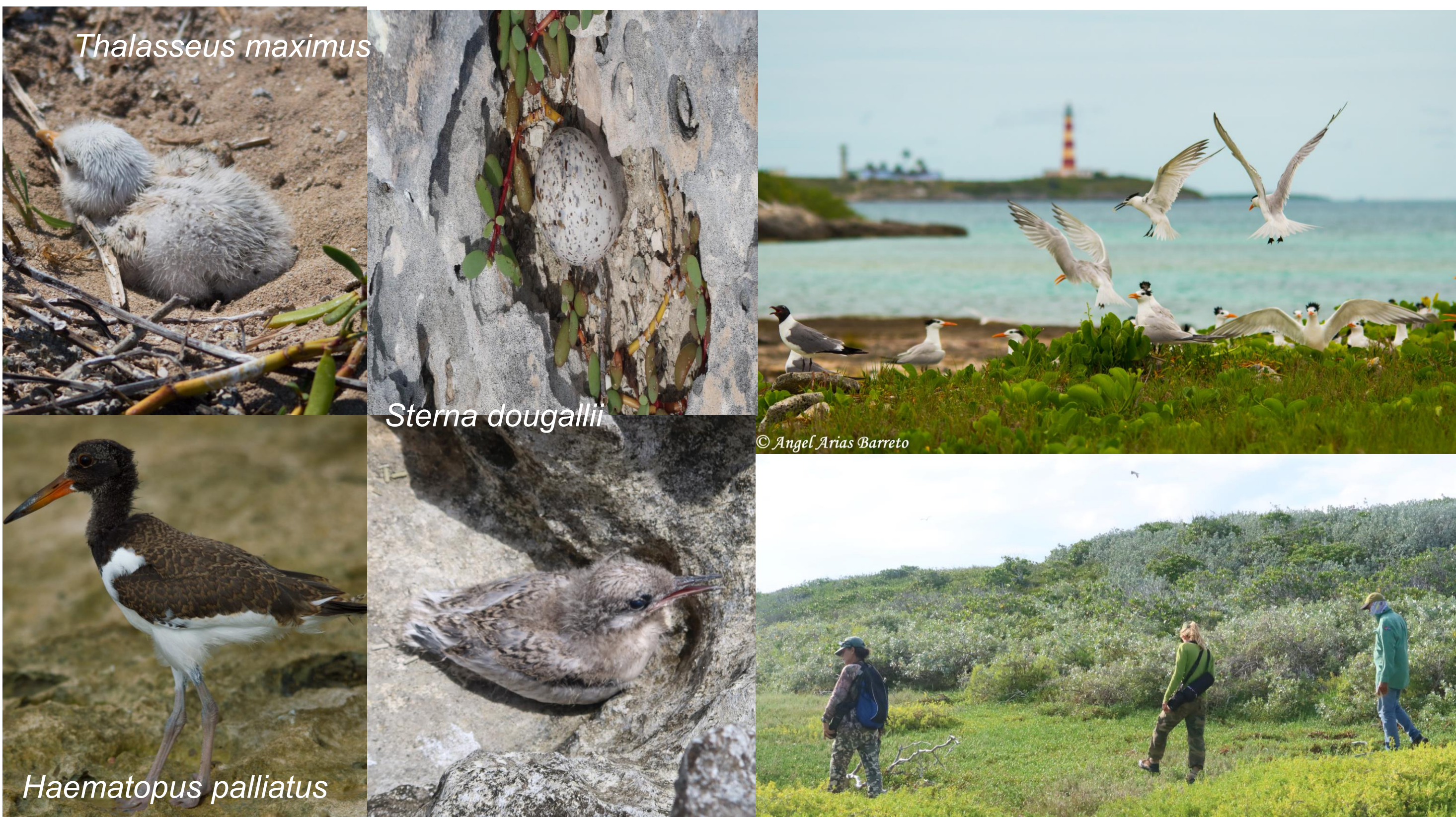
Figura 2. Imágenes de aves marinas y equipo de trabajo

Dadas la fragilidad de estos hábitats a amenazas de origen antrópico (desarrollo turístico, contaminación por plásticos, pesca, etc.) y natural (ciclones, sequías, aumento de temperaturas, etc.), desde el 2006 se viene estudiando la reproducción de especies de aves marinas en Los Caimanes. Estos monitoreos carecen de sistematicidad por la logística y el difícil acceso al área. Ante la importancia de estos hábitats para las aves marinas, en el marco de un proyecto de monitoreo nacional e internacional con el Corredor Biológico del Caribe, el objetivo de este trabajo fue caracterizar las colonias reproductivas de aves marinas en Los Caimanes durante el periodo 2020-2023.